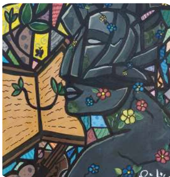
Sichu Shrestha, IX Gandaki The Man, Acrylic on Canvas