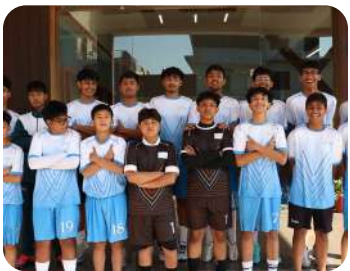
Thunderbolt Cup 2025 | Football | Students gaining experience, confidence, and sportsmanship on the field.