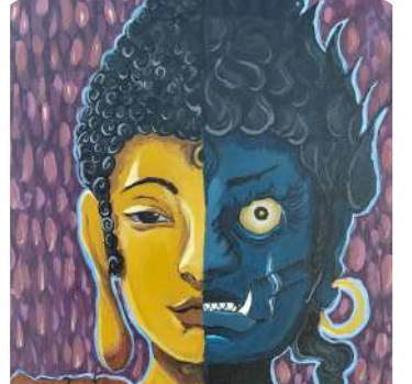
Norzin Sherpa, VIII Indrawati Human Nature, Acrylic on Canvas