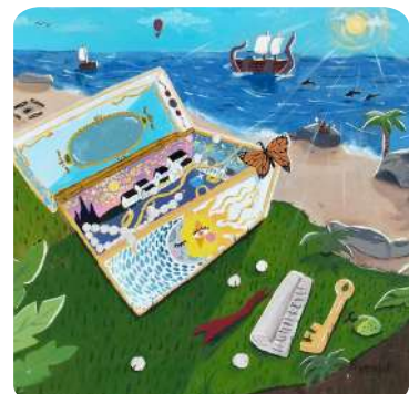
Priyanjali Sherchan, IX Babai Lost Treasure, Acrylic on Canvas