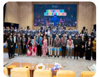
Orchestra Evening 2082 | A beautiful evening of music, harmony, and student talent.