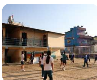
Women's Volleyball Friendship Match | Building bonds through teamwork and sportsmanship.