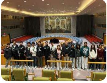
USA Tour 2025 | Learning global leadership at the United Nations and enjoying breathtaking views from One World Observatory.