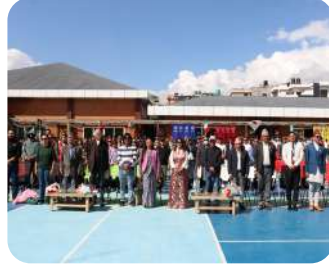
LaLaBaLa Festival 2025 – Opening | A grand opening to an international celebration of children's theatre and creativity.