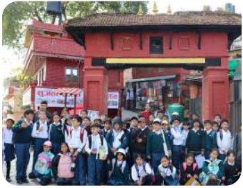
Grade IV Field Trip | Changu-narayan | History and culture brought alive through hands-on learning.