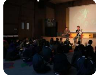
LaLaBaLa 2025 – Day 1 Evening Show | An inspiring opening night powered by young performers and imagination.