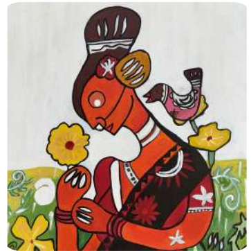
Prashant K. Upadhyay, VIII Indrawati Woman, Acrylic on Canvas