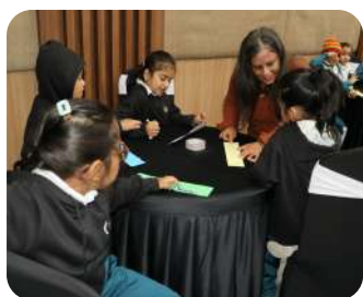
Grade 2 Life Skills Session | Learning kindness, empathy, and the importance of forgiveness.