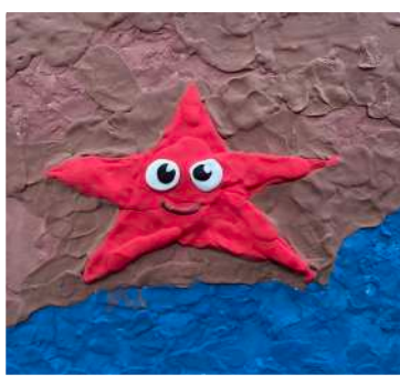
Kemi Gurung, I Tamor Star fish, Play Dough on Paper