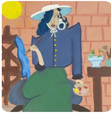
Ava & Benju, VIII Indrawati Painter, Acrylic on Canvas