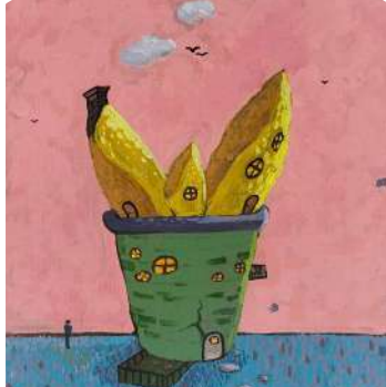
Lakeisha Khadgi, VII Karnali The World of Plants, Acrylic on Canvas