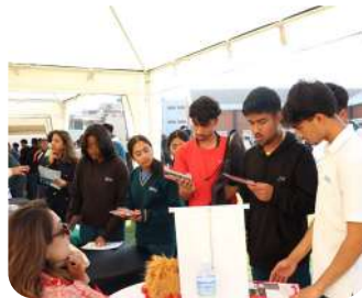
Global University Fair 2025 | Students exploring pathways to higher education around the world.