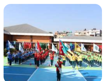
Annual Sports Meet 2025 – Opening Ceremony | A vibrant and energetic start to days of sports and celebration.