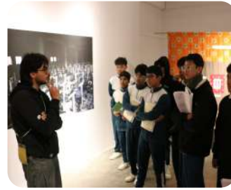
PhotoKTM6 Visit | Grade IX | Students engaging with art, stories, and global perspectives.