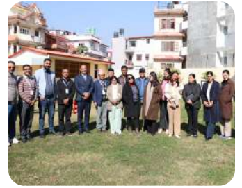
Kathmandu University M.Phil Visit | An enriching academic exchange focused on teaching and learning practices.