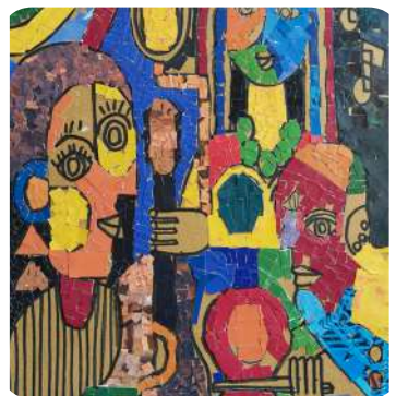
Students of Grade V Musicians, Collage on Paper