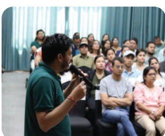
Quiz Competition | Encouraging critical thinking through healthy competition.