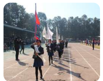
March Past Achievement | Discipline, coordination, and school pride on display.