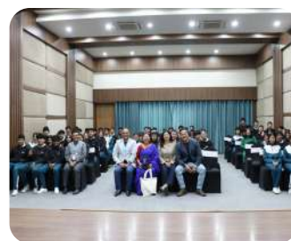
Kidspreneur Talk Series | Inspiring students with real-life entrepreneurial stories.