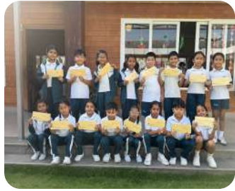
Friendship Mail Project | Students exchanging letters and building new friendships with joy.