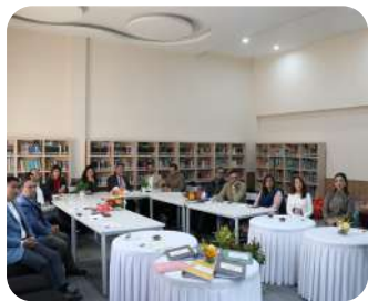
OKS Leaders' Meeting 2082 | Academic leaders collaborating for quality and growth in education.