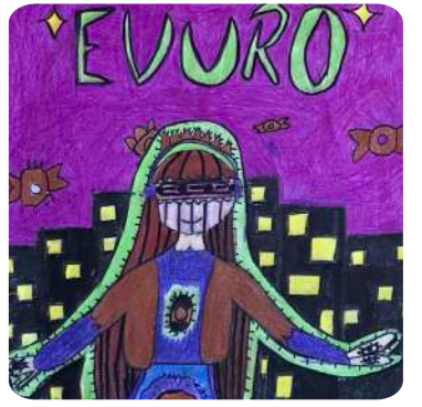
Evana Lamichhane, V Seti, Comic Poster, Coloured Pencil on Paper