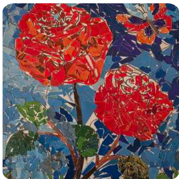
Students of Grade II Flowers, Collage on Paper