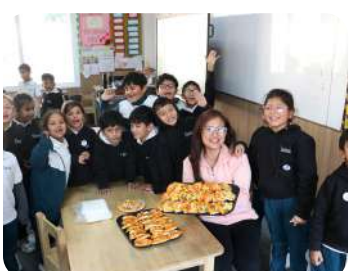
Grades 1-3 Curriculum Showcase | Expressing learning through culture, art, and creativity.