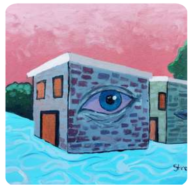
Shreyas B. Shakya, VII Karnali Houses with Facial Features Acrylic on Canvas