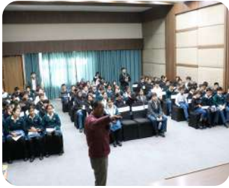
Guest Lecture | Architecture & Math | Connecting mathematics and science to real-world architectural design.