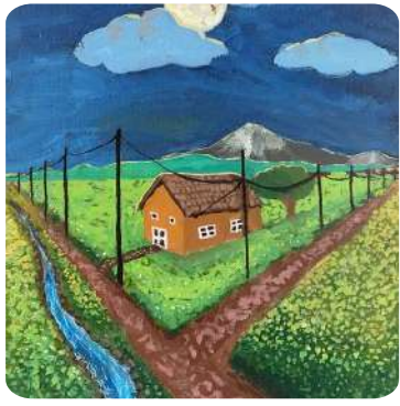
Aaradhya S. Pandit, VI Mahakali Midnight, Acrylic on Canvas