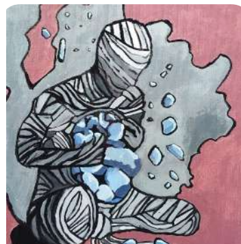
Sajin Gurung, VII Karnali Man Falling Apart, Acrylic on Canvas