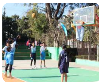
Basketball Tournament Achievement | A strong performance driven by teamwork and determination.