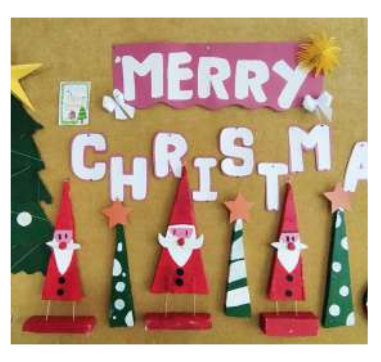
Students of Grade VIII Merry Christmas, Mixed Media on Board