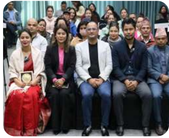
Parent Academy Session | A meaningful discussion on understanding and supporting preteen emotions.