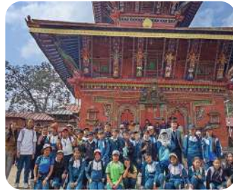
Grade V Field Trip | Changu-narayan | Exploring ancient heritage through experiential learning.