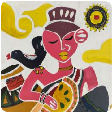
Arnab R. Basaula, VIII Indrawati Woman, Acrylic on Canvas