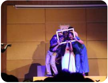
"Home" | Sri Lanka | A heartfelt performance exploring belonging, love, and identity.