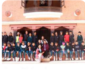
Grade 3 Educational Visit | Patan Durbar Square | Young learners exploring Nepal's rich cultural heritage.