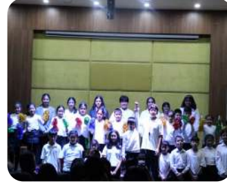
LaLaBaLa Festival 2025 – Opening | A grand opening to an international celebration of children's theatre and creativity.