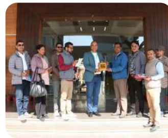
Academic Exchange Visit | Sharing ideas, practices, and perspectives through collaboration.