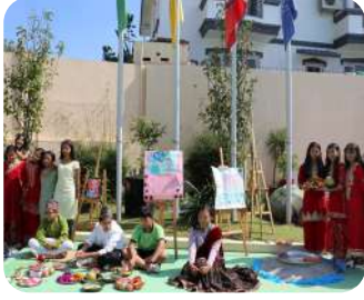
IWS Cultural Day – Tihar 2082 | Celebrating the colors, traditions, and spirit of Tihar with joy and pride.