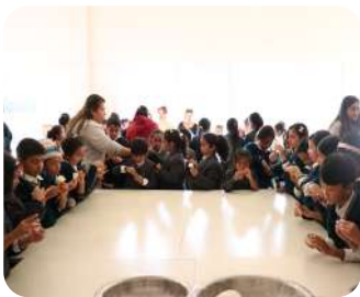
Yomari Punhi Celebration | Students learning culture by shaping tradition with their own hands.