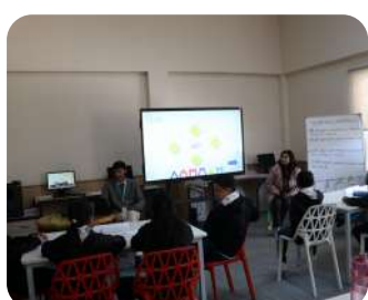
Grade 1 Cooking Activity | Learning healthy habits through fun, hands-on experiences.