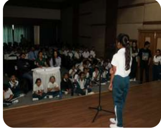
IWS Got Talent 2025 | A stage filled with confidence, creativity, and incredible student talent.