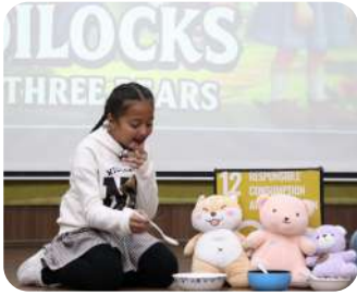
Storytelling Competition (Grades 1-3) | Young storytellers bringing characters to life with confidence.