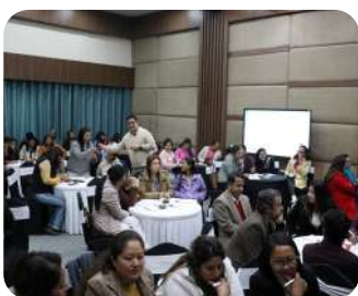
Preschool Educators Workshop | Empowering educators through professional learning and reflection.