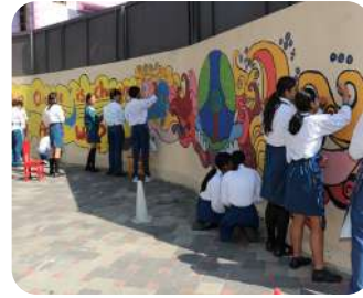
Art Club in Action | Students adding color, creativity, and new life to our parking area through vibrant wall art and decorations.