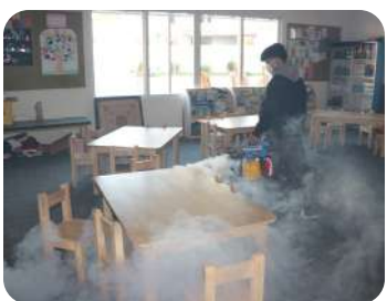
Campus Maintenance Activity | Ensuring a clean, safe, and healthy learning environment.