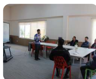
Driving Safety Forward | Our Transportation Department participating in an informative session by SIPRADI, focused on vehicle maintenance, traffic rules, and road safety—strengthening awareness, responsibility, and safe practices for everyday operations.