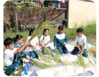
Learning from the Land | Our students joyfully harvesting the rice paddy they planted earlier—an enriching hands-on experience connecting learning, nature, and responsibility.